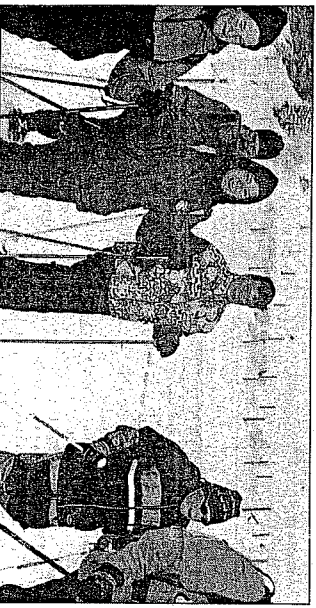
Le Brevet des armailleurs, c'est aussi une course familiale et conviviale où chacun va à son rythme.

ge, organisé conjointement par les offices du tourisme des Paccots et de Moléson et par le comité du Brevet des armailleurs (ad'été), sera certainement reconduit l'hiver prochain. CG